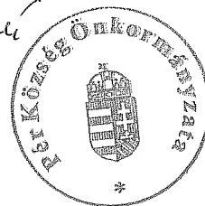
Rákli Lászlóné aljegyző