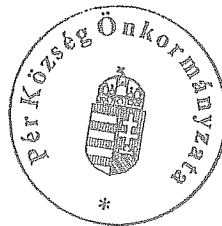
Herold Ádám Pér község polgármestere