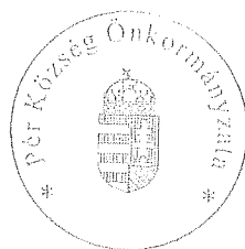
Rákli Lászlóné aljegyző